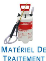
MATÉRIEL DE TRAITEMENT

Pièges, phéromones, repulsifs, matériel de traitement, Venez découvrir des produits complémentaires sur notre site. Depuis 2006 à votre service.