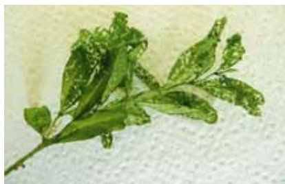
Feuilles ravagées par de jeunes chenilles, qui ne s'attaquent qu'à la face inférieure et laissent l'épiderme supérieur intact.

*Oelhafen A. (2012): Lutte contre la pyrale du buis Cydalima perspectalis avec des moyens biologiques, travail de bachelor, Haute école des sciences appliquées de Zurich ZHAW.