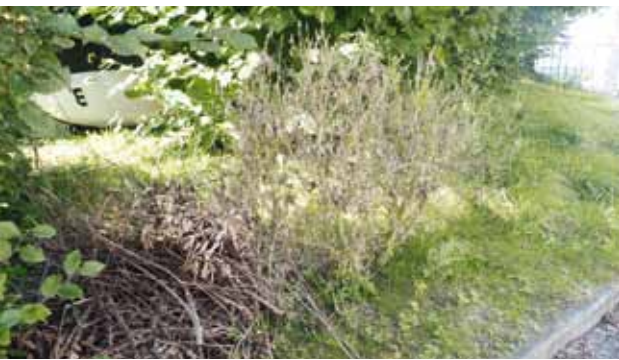
Plante entièrement défoliée.

Les chenilles fraîchement écloses mangent seulement la face inférieure de la feuille et provoquent des dégâts typiques. De par leur énorme appétit, des haies entières de buis peuvent en peu de temps se retrouver complètement dépouillées de leurs feuilles. Face à la propagation rapide et aux dégâts qui en résultent, et au vu des études scientifiques qui font défaut au sujet de l'efficacité d'insecticides biologiques, un travail de bachelor sur le thème de la «Lutte contre la pyrale du buis avec des moyens biologiques» a été réalisé à la Haute école des sciences appliquées de Zurich, Wädenswil, avec la participation de l'entreprise Andermatt Biocontrol AG.